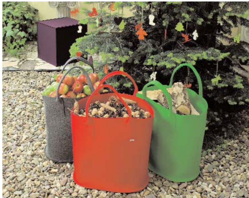
Woody, die große Filztasche, nimmt nicht nur Kaminholz auf Weitere Informationen Nr. 7

In der neuen Trendfarbe terra präsentiert sich daff ab August noch auf der Tendence Lifestyle und der Maison & Objet Paris.