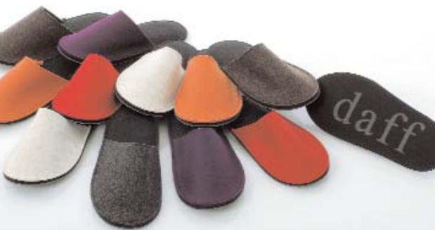
Der Sohlenbereich bei den Filzschlappen ist unterpolstert. Weitere Informationen Nr. 44

Freunde, Freizeit und schönes Ambiente stehen nach übereinstimmenden Aussagen der Zukunftsforscher ganz oben auf der Wunschliste unserer Gesellschaft. Dabei definieren sich immer mehr Menschen über ihr Zuhause und suchen nach Ideen, durch die sie ihre Wohnung ständig neu erfinden können: mit kreativen Produkten, Mut zur Farbe und zu unkonventionellem Mix und Match wird aus dem „trauten Heim“