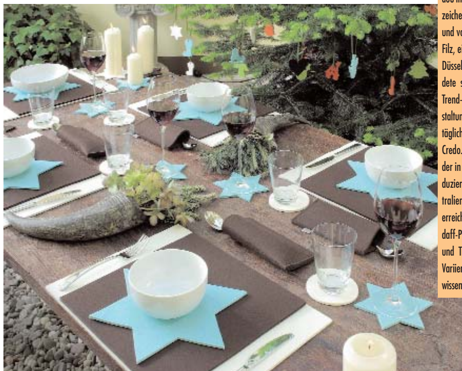
Für den Festtagstisch: Sets, Sternuntersetzer und Bestecketuis Weitere Informationen Nr. 10

Filz, eines der ältesten Naturmaterialien, hat es auch der Düsseldorferin Carin Benter angetan: Vor 5 Jahren gründete sie das Unternehmen daff domestic affairs, das Trend-Kollektionen zur dekorativen Tisch- und Wohngestaltung sowie Taschen und Gesellschaftsspiele herstellt. Alltäglichen Dingen einen neuen Look geben, so lautet ihr Credo. Verwendet wird ausschließlich feinstes Merino-Filz, der in Deutschland exklusiv für daff domestic affairs produziert wird. Nur mit den hochwertigen Wollen aus Australien und Südafrika kann nämlich die Farbbrillanz erreicht werden und die cashmere-ähnliche Haptik, die die daff-Produkte auszeichnen. Die Farbpalette, die 24 Basis- und Trendfarben umfasst, lädt zum Kombinieren und Variieren ein – ein Aspekt, den die Kunden zu schätzen wissen und damit ihrer Kreativität gerne freien Lauf lassen.